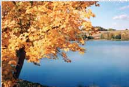
für jede Jahreszeit