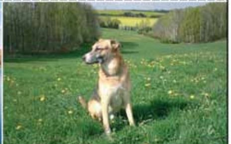
für alle Familienmitglieder