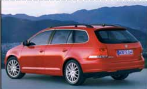
mit der größten Klappe