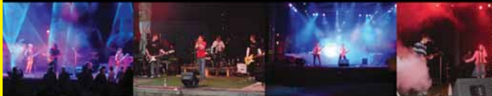
Eintritt Freitag/Samstag jeweils: Erwachsene 2,50 € - Kinder bis 3 Jahre frei - Kinder bis 12 Jahre 0,50 €