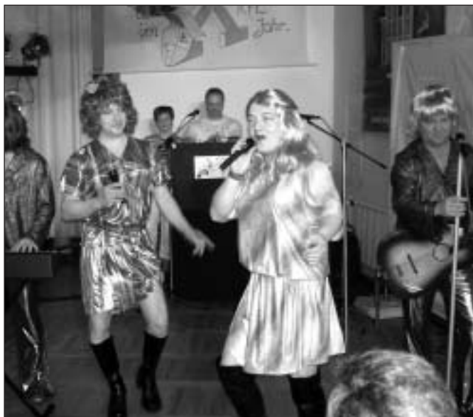
Die ABBAS in Aktion