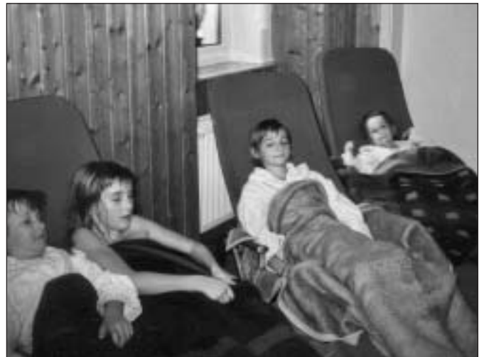
Frohes Schwitzen und allzeit Gesundheit wünschen die Sauna-Kids vom "Spatzennest"!