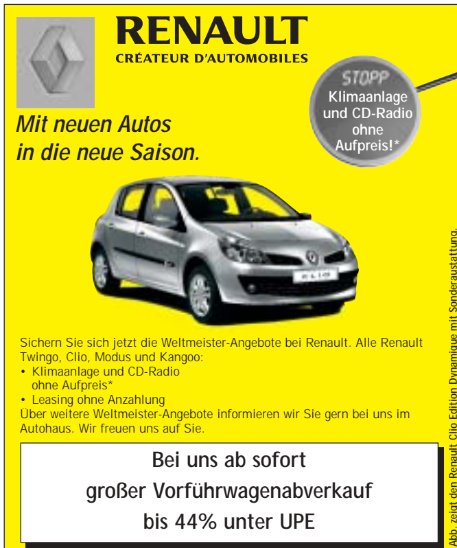
Abb. zeigt den Renault Clio Edition Dynamique mit Sonderausstattung.