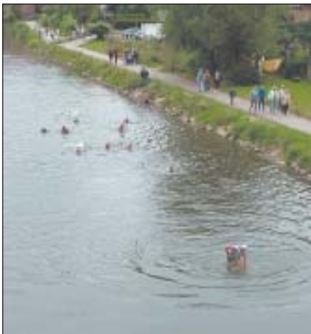
Die Champions des letzten Jahres bei der ersten Etappe des Triathlons

Für das leibliche Wohl sorgt der Angelsportverein Lunzenau e.V., der an diesem Tag ab 11:00 Uhr seinen 1. Familienangeltag ausrichtet.