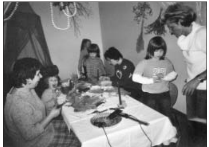
Gesteckebasteln - denn bald wirds Weihnacht