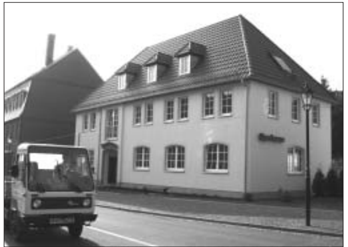
Vorderansicht des neuen Gebäudes

Nach einer Bauzeit von lediglich 7 Monaten eröffnete die Kreissparkasse ihre neue Geschäftsstelle Lunzenau. Nach langjähriger Vorbereitungs- und Planungsphase, die Sparkasse erwarb im Jahr 1994 das Grundstück, eröffnete das älteste Geldinstitut unserer Stadt sein erstmals eigenes Gebäude. Das Gebäude fügt sich harmonisch und städtebaulich gelungen in das Lunzenauer Stadtbild ein.