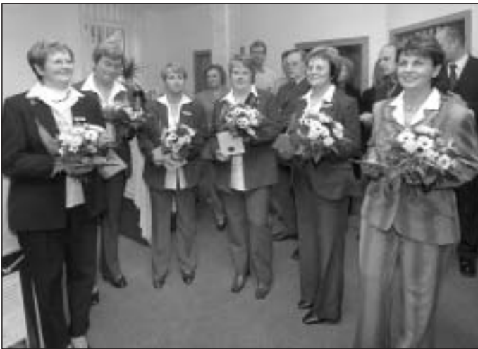
Das Serviceteam