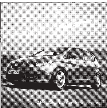
Abb.: Altea mit Sonderausstattung

Das ist kein neues Auto, das ist ein neues Zeitalter!