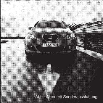
Abb.: Altea mit Sonderausstattung

Der neue SEAT Altea . Der aufsehenerregende Vorreiter einer völlig neuen Ära von sportlichen Automobilen: Herausragend im Design, atemberaubend in der Performance, mit einem überzeugenden Angebot an Stauraum. Ein perfektes Zusammenspiel aller Komponenten mit nur einem Ziel: Maßstäbe zu setzen. In der Gegenwart – für die Zukunft.